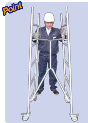
Point 保管時もコンパクトに折り畳めるので場所を取りません