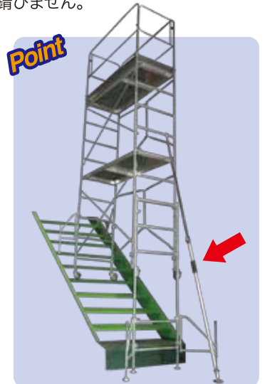
Point オプションの突っ張り棒で足場を補強し揺れを軽減