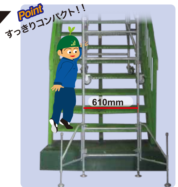
Point すっきりコンパクト!!